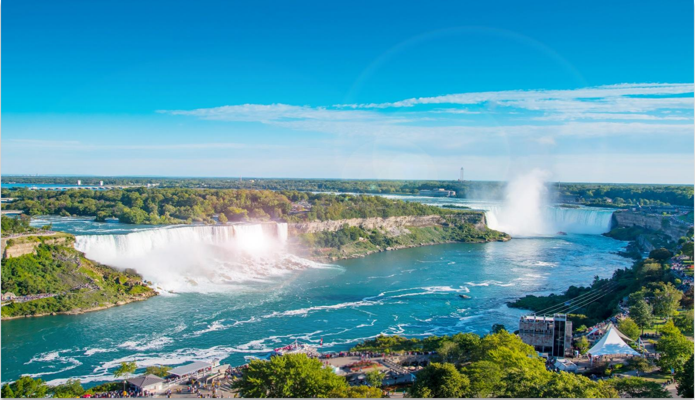
NIAGARA FALLS STATE PARK

นำท่านเดินทางสู่ “อุทยานแห่งชาติไนแองการ่า” (Niagara Falls State Park) ฝั่งสหรัฐอเมริกา หนึ่งในสิ่งมหัศจรรย์ทางธรรมชาติของโลก ที่ได้รับการยกย่องให้เป็นสถานที่ท่องเที่ยวยอดนิยม และเป็น หนึ่งในสามจุดหมายปลายทางสุดโรแมนติกสำหรับการดื่มด่ำน้ำfallsพระจันทร์ของคู่บ่าวสาวชาวอเมริกัน น้ำตกไนแองการ่า