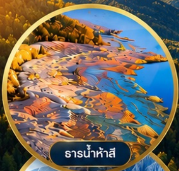
ธารน้ำห้ำสี่