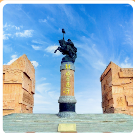
เขตท่องเที่ยวเจงกีสข่าน