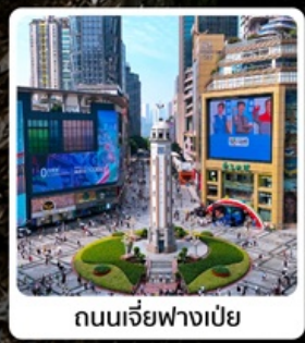
ถนนเจียฟางเป่ย์