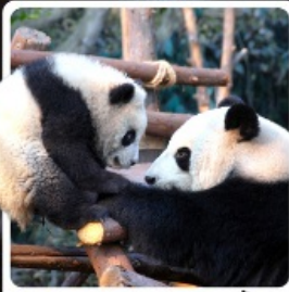
หุบเขาแพนด้าดูเจียงเอี้ยน

ไฮไลท์! อุทยานแห่งชาติปี้ตงโกว สวิตเซอร์แลนด์น้อยแห่งตอนตะวันตก ชมความน่ารักของหมีแพนด้า ณ หุบเขาแพนด้าดูเจียงเอี้ยน