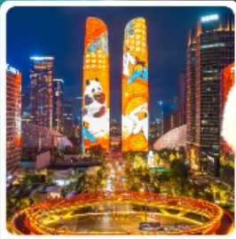
ตึกแฝดเจิงตุ