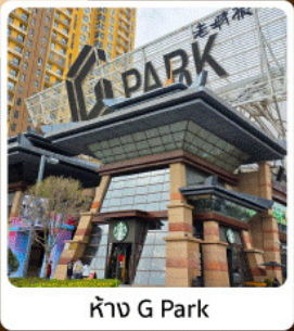
ห้าง G Park