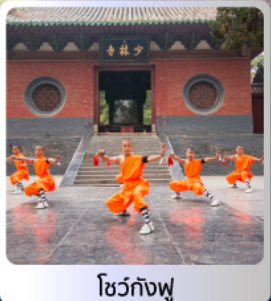
โชว์กังฟู