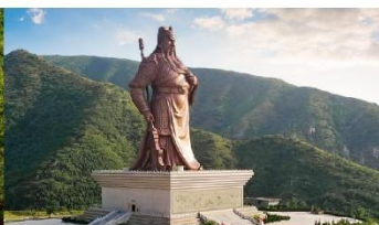
บ้านเกิดกวนอู