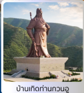
บ้านเกิดท่านกวนอู

อาหารมือพิเศษ บุฟเฟ่ต์ สุกี่หม้อไฟ เปิดปิกกิ้งซีอาน