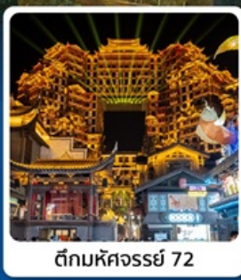
ตีทึมหัตจอรร์ยี่ 72