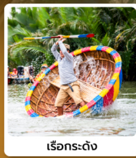
เรือกระดง