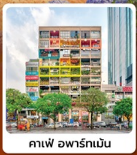
คาเฟ่ อพาร์ทเม้น