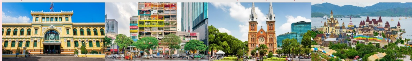
ไพรชฌ์กลางโฮจิมินห์