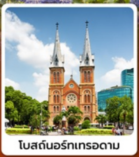
โบสถ์นอร์ทเทรอดาม