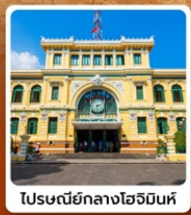
ไปรษณีย์กลางโฮจิมินห์