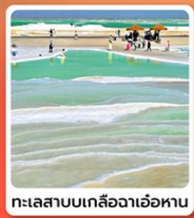
ทะเลสาบเกลือดาเอ้อหนาน

ไฮไลท์! กำมั่วเกาถู กำพุทศิลปิโบราณ มรดกโลก UNESCO ภูเขาสายรุ้งจางเย่ ภูเขาหินสีสลับแปลกตา หนึ่งในภูมิประเทศที่แปลกที่สุดในโล