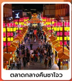
ตลาดกลางคืนซาโจว