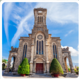
โบสถ์หินญาจาง