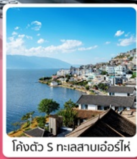
โคงตั่ว S ทะเลสาบเออร์ไห่