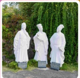
สวนถ้ำสามสกาย