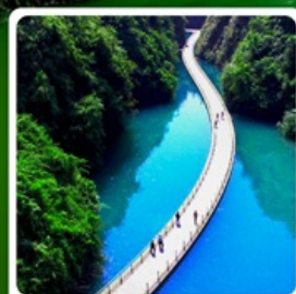
คุบเขาสิงโต

ซูปตาร์...ดวงดาว ก้อนเมฆ ขุนเขา สองเราเอินซือ จางเจียเจี๋ย