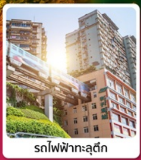
รถไฟฟ้าทะเลติก