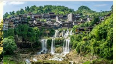
หมู่บ้านโบราณผู่หลงเจิน

*ทางบริษัทฯ ขอสงวนสิทธิ์ในการสลับโปรแกรมทัวร์ตามความเหมาะสมขึ้นอยู่กับสถานการณ์หน้างาน โดยคำนึงถึงผลประโยชน์ของลูกค้าเป็นสำคัญ