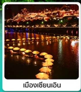
เมืองเซียนเจิน