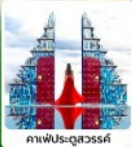
คาเฟ่ประตูสวรรค์

• ไฮไลท์ พิธีขอตีฆ้องพ่นฮีน ชมนิวเมืองซาปาแบบ 360 องศา สัมผัสกลิ่นอายยุโรปที่ปราสาทตามด้าว เช็กอินคาเฟ่สุดเก๋ประตูสวรรค์