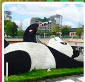
รูปปั้นหมีแพนด้าอนุเชลฟ์