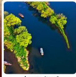
อ่าวพระจันทร์