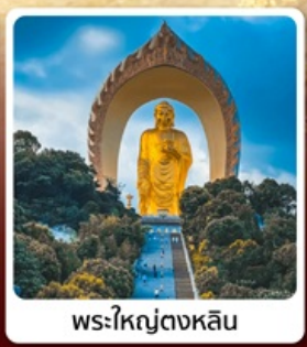
พระใหญ่ตงหลิน