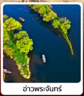
อ่าวพระจันทร์