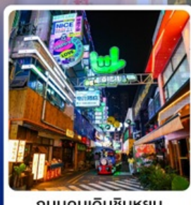
ถนนคนเดินซินหยุน