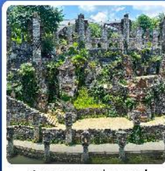
ปราสาทหินเย่หลางกู่

● ไฮไลท์ น้ำตกหวงกั๋วซู่ น้ำตกที่ใหญ่ที่สุดของจีน แหล่งท่องเที่ยวระดับ 5A ชมความสวยงาม หมู่บ้านวูเจียงจ้าย หมู่บ้านจินโบราณ