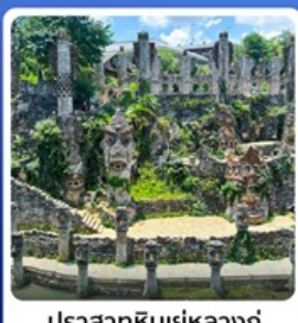
ปราสาทหินเย่หลางกู่