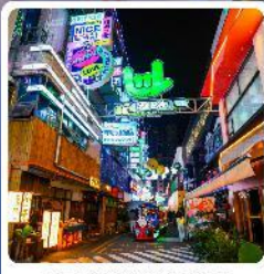
ถนนคนเดินซินเหยุน