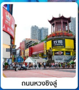
ถนนหวงซิงลู่

● ไอโกล์ เที้ยวสองเมือง จางซา จางเจียเจีย เช็คอินประตูสวรรค์ อุกยานเทียนเหมินซาน