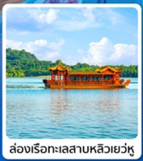
ล่องเรือทะเลสาบหลิวเยว่หู