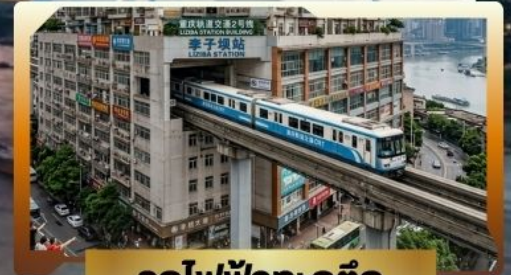
รถไฟฟ้ากะลุ่ก