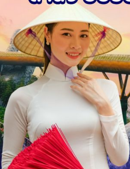
เที่ยวบานาฮิลล์