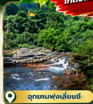
อุทยานฟงเลี่ยนซี