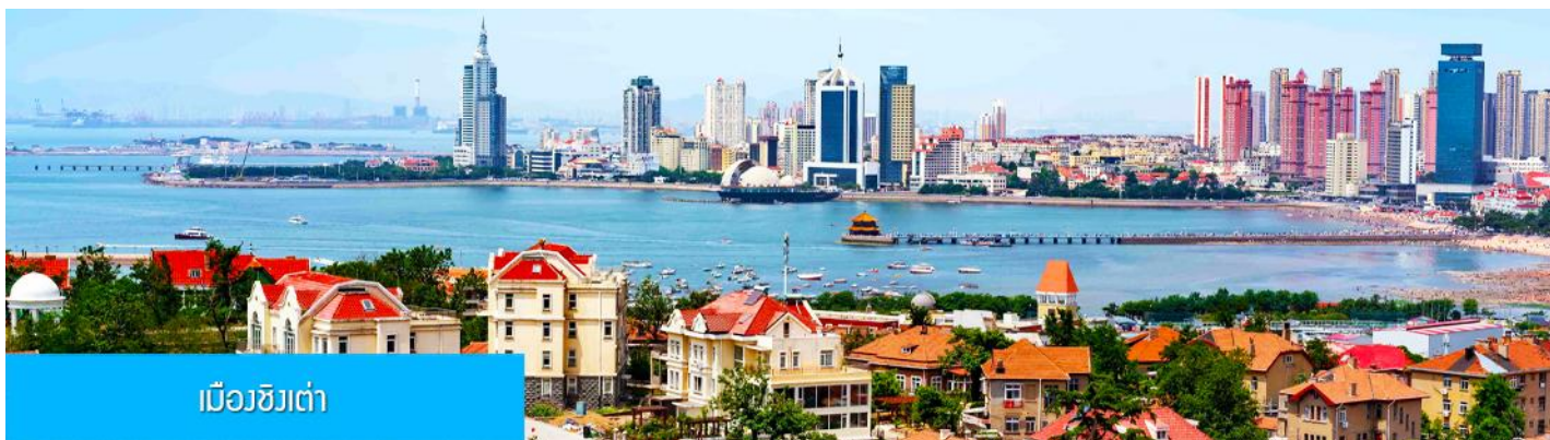
เมืองชิงเต่า