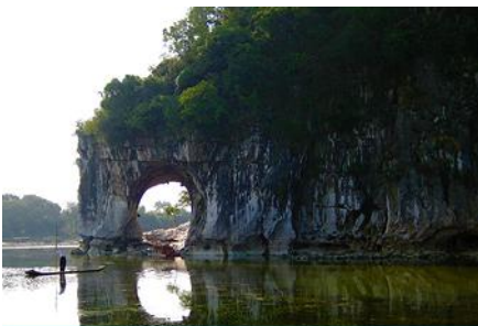
เขาวงช้าง

พักที่ GUILIN VIENNA HOTEL โรงแรมระดับ 4 ดาวท้องถิ่น หรือเทียบเท่าในเมืองกุ้ยหลิน