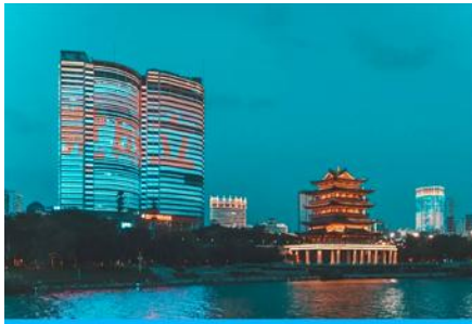
ล่องเรือแม่น้ำยวเจียง