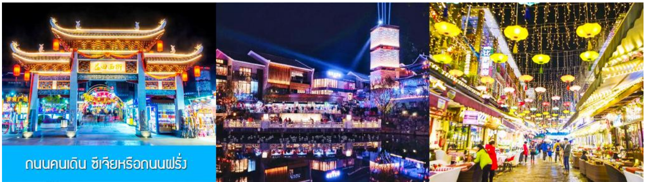
ถนนคนเดิน ซิเจียหรือถนนฝรั่ง