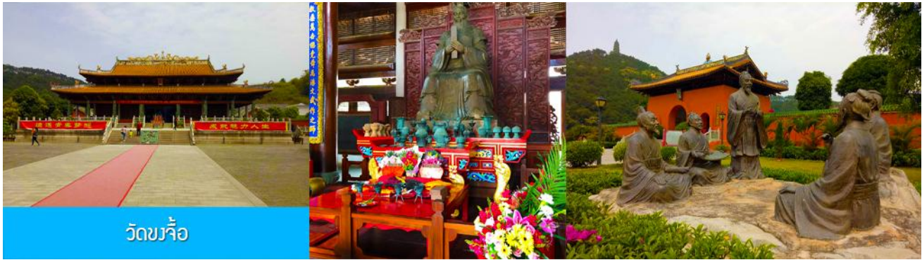
วัดขงจื้อ