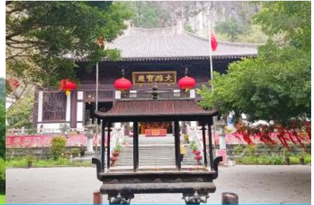
วัดซีเสี่ย