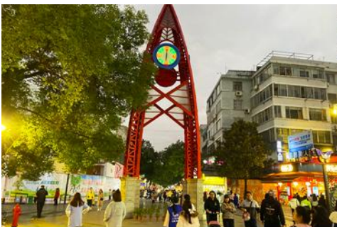
ถนนคนเดินเงินหยางลู่