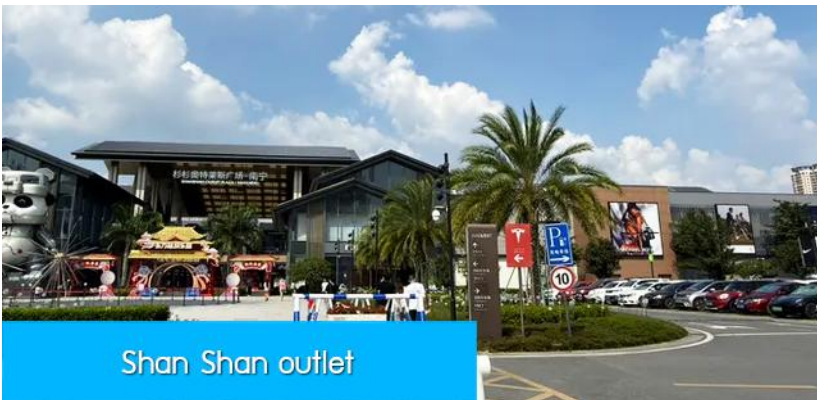
Shan Shan outlet