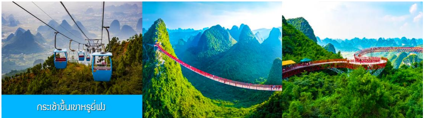
กระเช้าขึ้นเขาหญี่ฟง