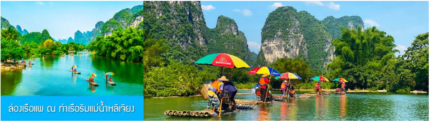
ล่องเรือแพ ณ ท่าเรือริมน้ำหลีเจียง