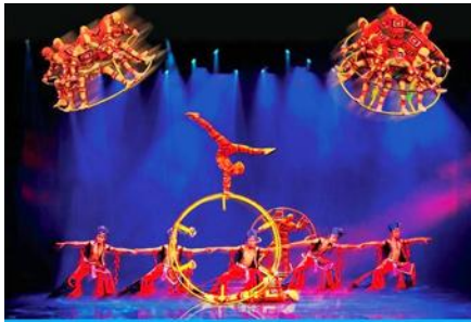
THE MIRAGE GUILIN