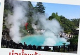
บ่อน้ำพุร้อน เบริปู

หมู่บ้านยูฟูอินฟลอร์ริล ทะเลสาบคินริน ทะเลสาปคินริน บ่อน้ำพุร้อน อุมิจิโกกุ ท่าเรือโมจิโกะ เรโร ตลาดปลาคาราโตะ ศาลเจ้ามียาจิดาเกะ ดิวตี้ฟรี ฟุกุโอกะ เบย์ พลาซ่า ช้อปปิ้งออน มอลล์ สินคู้เมโอโตะอิวะ ชมดอกไม้ไฮเดรนเยีย รอบน้ำตกชิราอิโตะ ช้อปปิ้งย่านเท็นจิน