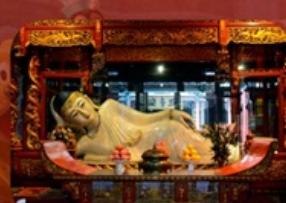
สักการะวัดพระหยกขาว