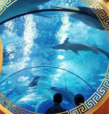
เซี่ยงไฮ้อาเซียนอะควาเรียม