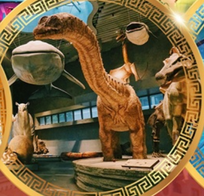
พิพิธภัณฑ์ธรรมชาติเซี่ยงไฮ้