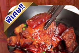
พิเศษ!! เมนูหมูสามชั้นตุ๋นน้ำแดง

พักโรงแรม 4 ดาว ★★★★★ ฟรี ประกันอุบัติเหตุ บริการอาหารท้องถิ่น