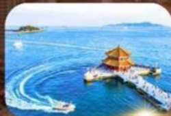
สะพานฉันเจียว