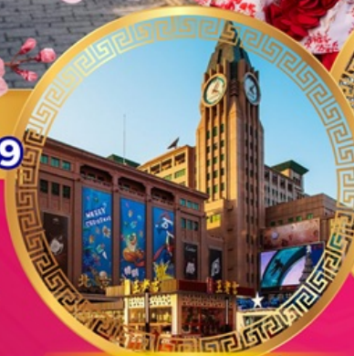
ถนนคนเดินหวังฝูจิ่ง

เที่ยวย่านการค้าดังกลางกรุงปักกิ่ง ถนนคนเดินหวังฝูจิ่ง จัตุรัสเทียนอันเหมิน พระราชวังกุ๊กกิง หอฟ้าเทียนถาน ช้อปปิ้งย่านซานหลี่ถุน พระราชวังฤดูร้อนอวิ๋เหอหยวน กำแพงเมืองจีนด่านอวิ๋หยงกวน ชมชากระดาน สักการะวัดลามะ