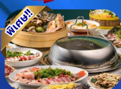
บุฟเฟ่ต์เช้า