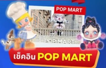
เช็คอิน POP MART