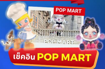
เช็คอิน POP MART