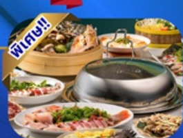
บุฟเฟ่ต์เช้า