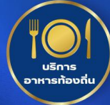
บริการอาหารท้องถิ่น