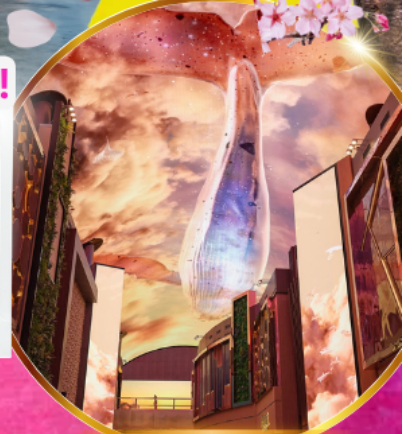
Aurora Media Art