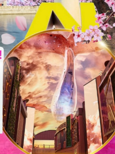
Aurora Media Art

ชมศิลปะดิจิทัลสุดล้ำ บนจอ LED เสมือนจริงขนาดยักษ์ อีสะระช้อปปีงย่านดัง คังนัม เมียงดง ฮงแด ซองซู ช้อปปลอดภาษี Lotte Duty Free