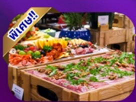
Buffet Dinner Banahill