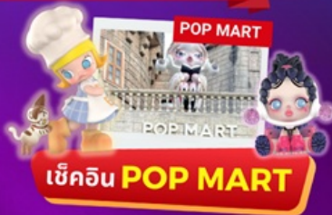
เข้คอิน POP MART