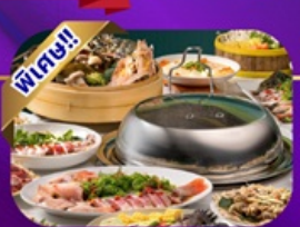
ซูฟไฟต์ชาบู