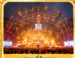
สถานที่จัดงาน เทศกาลเบียร์ชิงเต่า