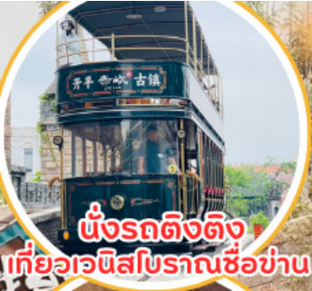
นั่งรถติ่งติ่ง เที่ยวเวนิสโบราณชื่อข่าน