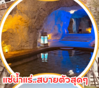
แช่น้ำแร่..สบายตัวสุดๆ