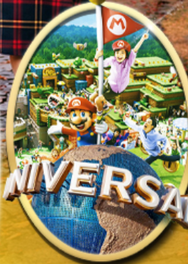
อิสระเลือกซื้อบัตร Universal Studios Japan