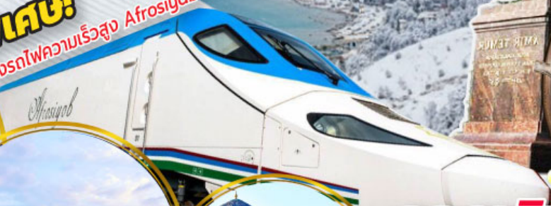
จัตุรัสเรจิสถาน