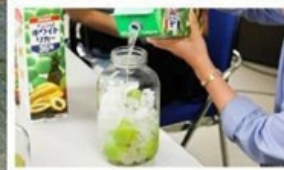
เวิร์กช็อปทำ Umeshu