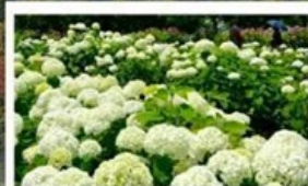
ชมดอกไม้ไฮเดรนเยีย