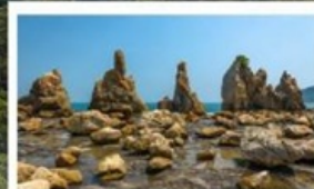
ชายหาดหินอาซึกุอิวะ

โหลด 23 KG. x2 ( รวม 46 KG. ) ทั้งไป - กลับ