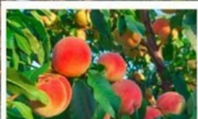
เก็บลูกพีชสด ๆ จากต้น