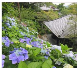
วัดฮาเซเดระ(เดรนเยีย)