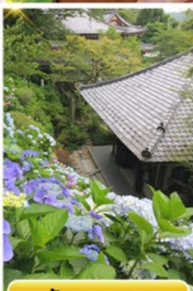
วัดฮาเซเดระ