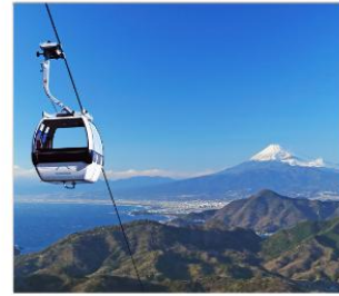
ชิบุพานิรามาริว