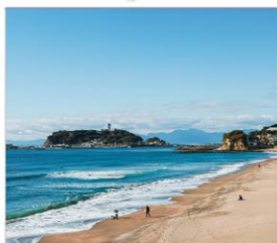
เกาะเอโนชิมะ