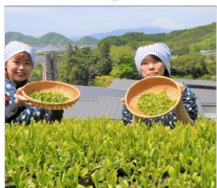
กิจกรรมเก็บชา