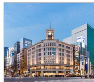
กินซ่า ช้อปปิ้ง