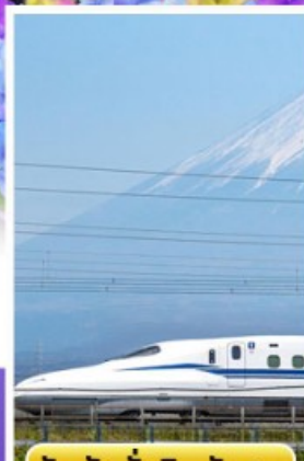
สัมปัสนั่งชินคันเซน