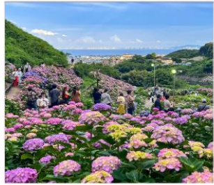
เทศกาลดอกไฮเดรนเยีย