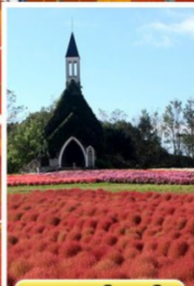
สวนบกกะโนะซาโตะ