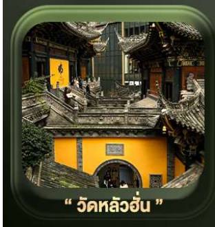
“ วัดหลิวฮั่น ”