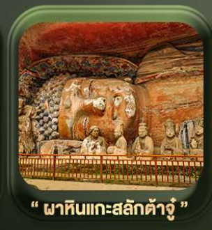
“ ผาหินแกะสลักต้าจู้ ”

บินตรงลงวงซิ่ง • อุ่หลง หลุมฟ้าสะพานสวรรค์ • ระเบิดึงแก้ว • อุทยานเขานางฟ้า หงหยาดัง • นิ่งรถไฟทะลุตึก • ศาลาประชาม (ด้านนอก) • หลงหมินฮ่าว มรดกโลกผาหินแกะสลักต้าจู้ • วัดหลิวฮั่น • ตึกตะเกียบ • ถนนคนเดินเจียฟางเปย์