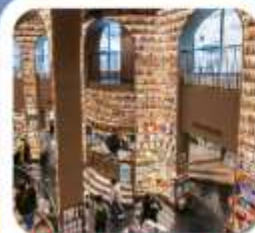
"ห้องสมุดจงซูเก๋"