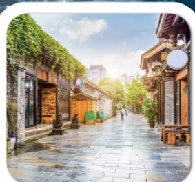
"ชอยกว้างชอยแคบ"