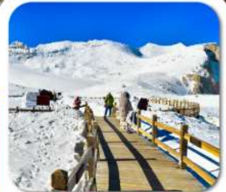
"ต่ากู่กลาเซียร์"

เที่ยวชมความงาม 3 อุทยานชื่อดัง : สีดรุณี • ปี่เผิงโกว ต่ากู่กลาเซียร์ ชมความน่ารักของหมีแพนด้า • จตุรัสหยางเทียนวู่ ชอยกว้างชอยแคบ • ถนนคนเดินซุนซีสู๋ • POP MART