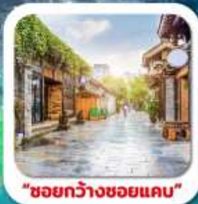
"ชอยกว้างชอยแคบ"