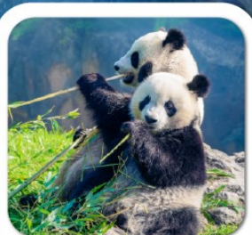
"ศูนย์หมีแพนด้า"