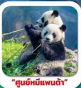
"สุยหมีแพนด้า"