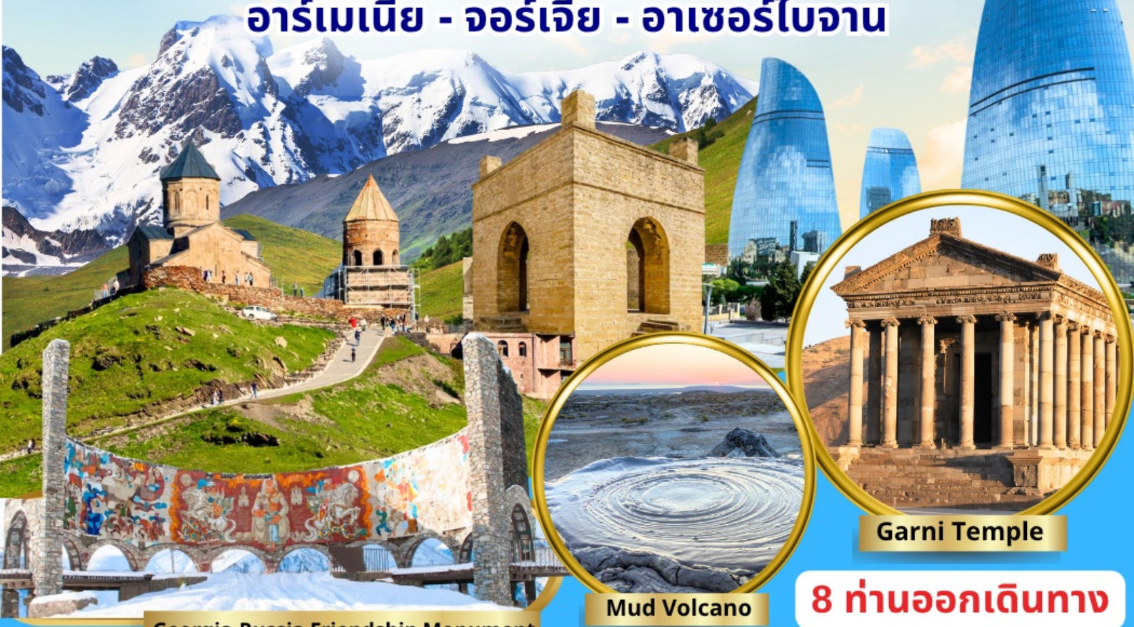
Georgia-Russia Friendship Monument