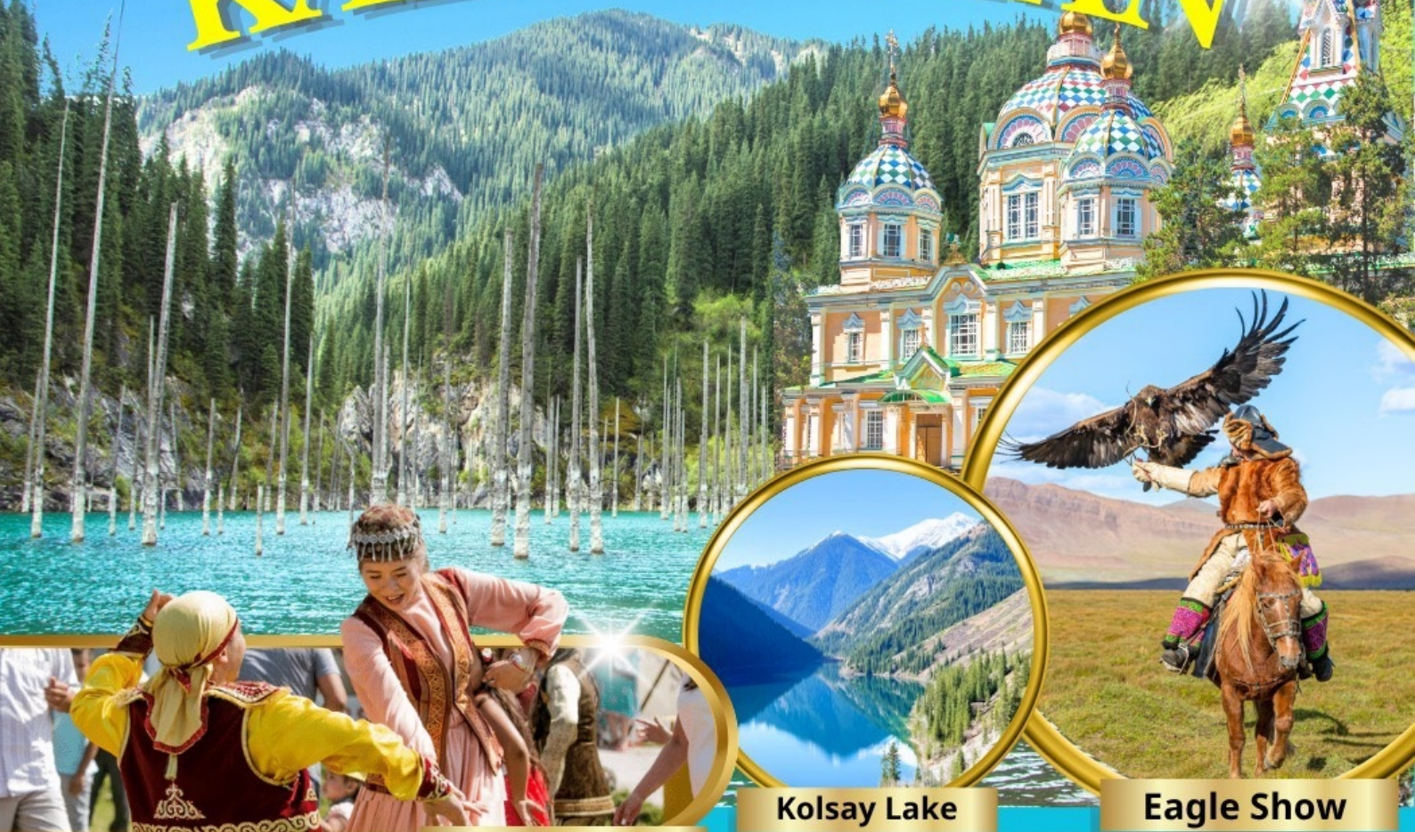
Huns Ethno Village