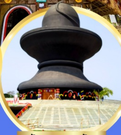
วันมหาฤตยูชัย