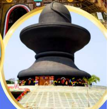
วัดมหาฤตยูชัย