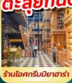
ร้านไอศกรีมมียาฮาร์