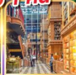
ร้านไอศกรีมมียาฮารา